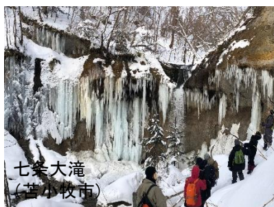
七条大滝 (苫小牧市)