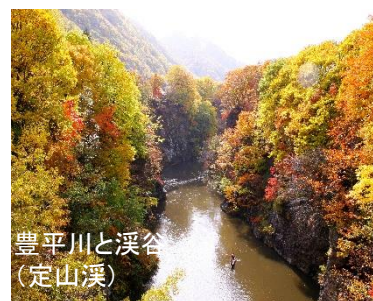
豊平川と溪谷 (定山溪)