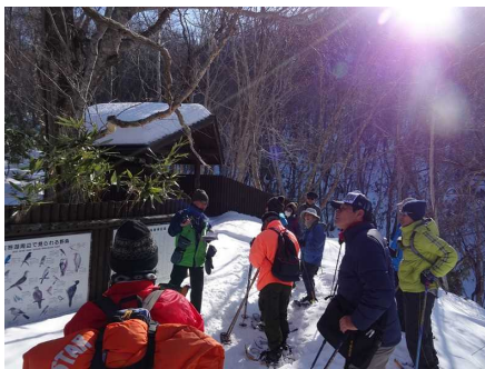
クマガラとアカゲラの違いを説明