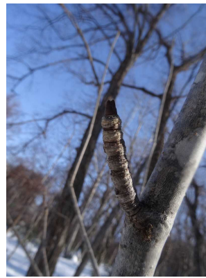
コシアブラの冬芽