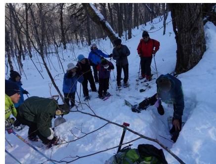
雪の断面を掘り、温度を計測中