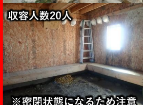
※密閉状態になるため注意