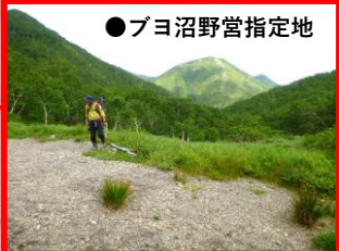
●プロヨ沼野営指定地