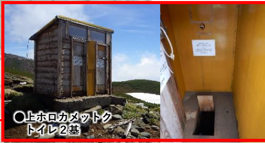
●上ホロカメットクトイレ2基