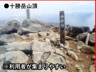
●十勝岳山頂 ※利用者が集まりやすい