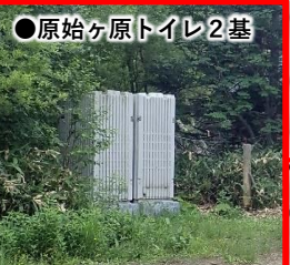
●原始ヶ原トイレ2基