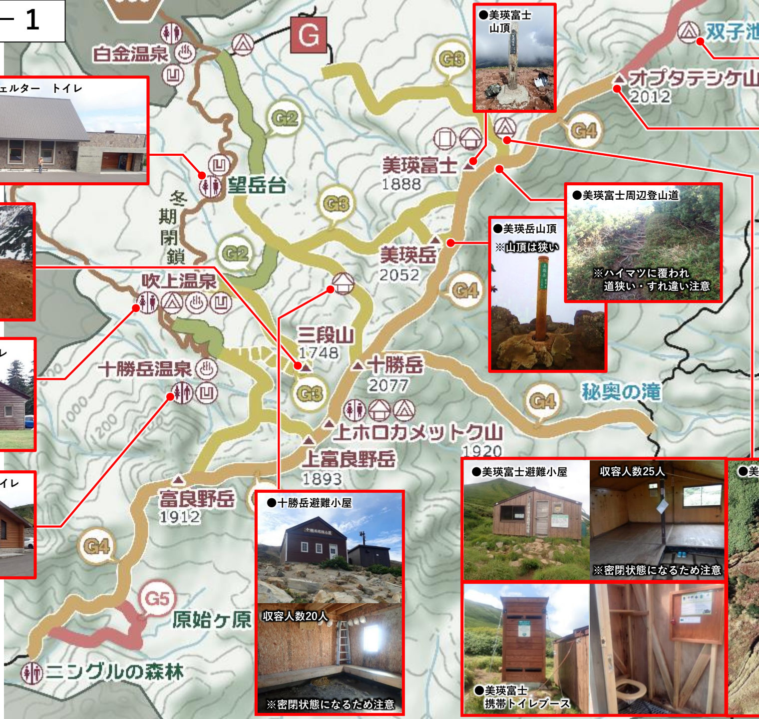
●十勝岳望岳台防災シェルター トイレ