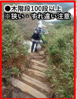
●木階段100段以上 ※狭い・すれ違い注意