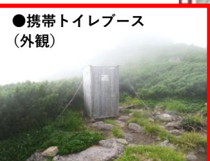
●携帯トイレブース (外観)