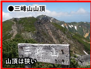
●三峰山山頂 山頂は狭い