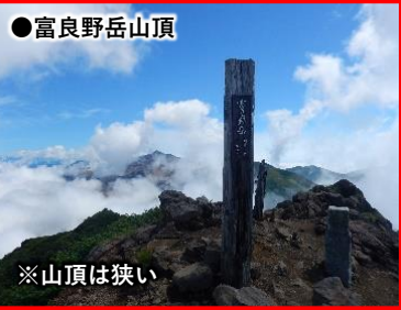
●富良野岳山頂 ※山頂は狭い