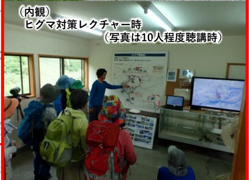
（内観） ヒグマ対策レクチャー時 （写真は10人程度聴講時）