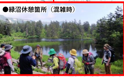
●緑沼休憩箇所（混雑時）