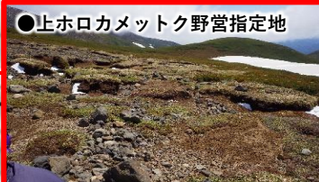
●上ホロカメットク野営指定地