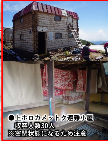
●上ホロカメットク避難小屋 収容人数30人 ※密閉状態になるため注意