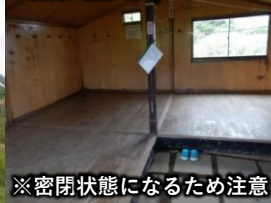
※密閉状態になるため注意