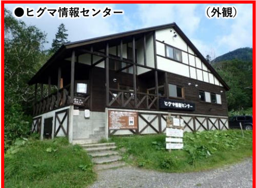
●ヒグマ情報センター（外観）