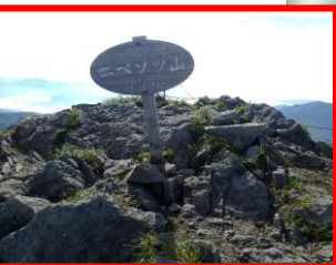
●ニペソツ山山頂 山頂は狭い