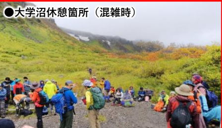
●大学沼休憩箇所（混雑時）