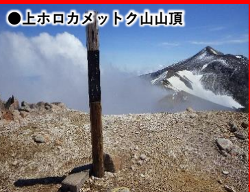
●上ホロカメットク山山頂