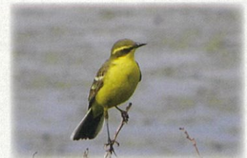
ツメナガセキレイ