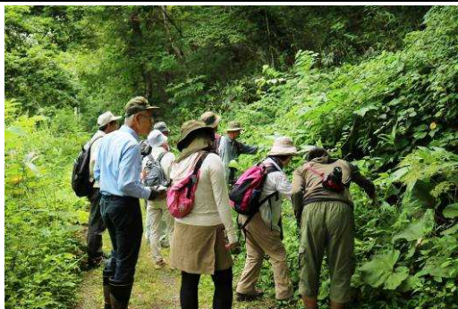
おもしろいものが見つかりました