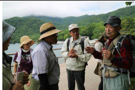
何気ない植物にも物語が…