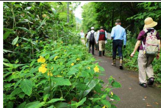
キツリフネの咲く小道