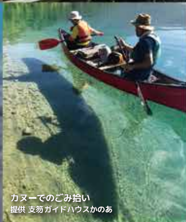
湖底清掃