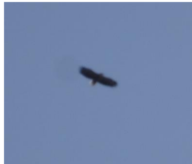
オジロワシ飛翔中