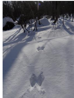
エゾリスの足跡発見！