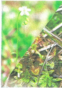
▲モウセンゴケ 花7月下旬～8月下旬