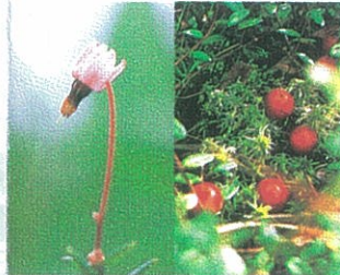
▲ツルコケモモ 花6月下旬～7月下旬 実8月上旬～10月上旬