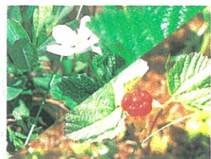
▲ホロムイイチゴ 花5月下旬～6月上旬 実8月下旬～9月下旬