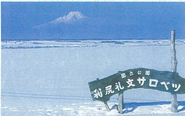
▲冬のサロベツ原野