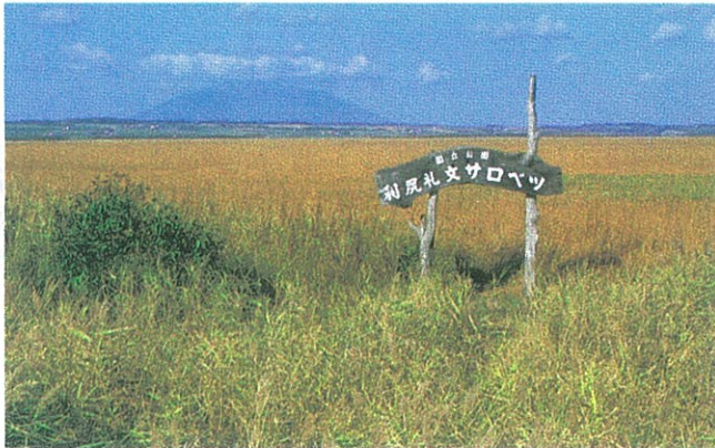
▲晩秋のサロベツ原野

面積約2万ha、東西約8km・南北約27kmにわたって広がる、日本の低地における代表的な湿原で、特に高層湿原から中間湿原の植生が発達しています。また、地平線が見える独特の景観も注目されています。