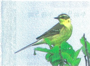
▲キムツツメナガセキレイ