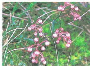
▲ヒメシャクナゲ 花5月下旬～6月下旬