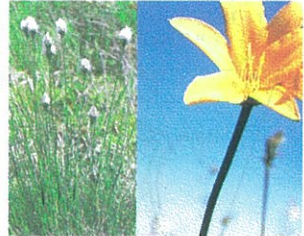
▲エソカンソウ 花6月下旬～7月下旬