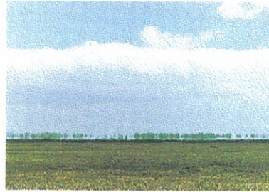
▲春から夏にかけて見られる曇気楼