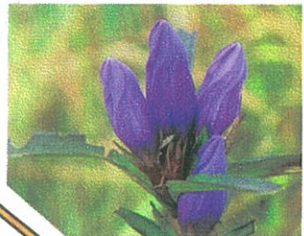
▲エソリンドウ 花8月下旬～9月下旬