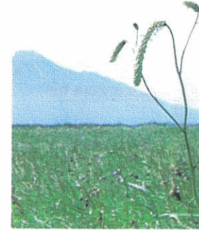
▲ナガボノシロワレモコウ 花8月上旬～9月下旬