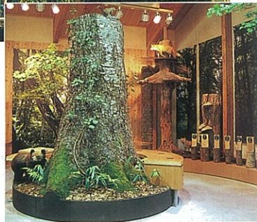
実物展示 マカバ 直径1.2m