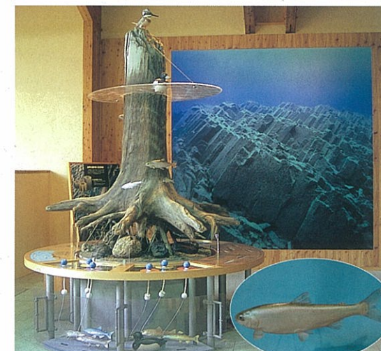
湖底木のジオラマと水中の様子