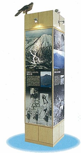
実物大 (約9m) のグラフィック