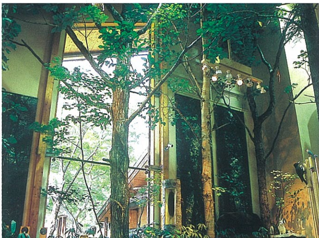
支笏の森の景観と環境