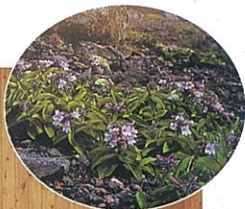
タルマイソウ (イワブクロ)