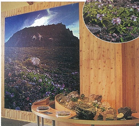
樽前山の厳しい気象条件に適応した植物たち