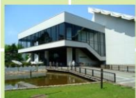
北海道立近代美術館