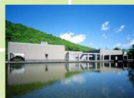
札幌芸術の森美術館