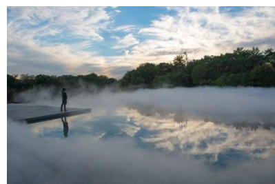
中谷美二子〈参考作品〉 《Fog Sculpture #47636“風の記憶”》2013