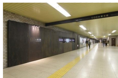
札幌大通地下ギャラリー500m美術館