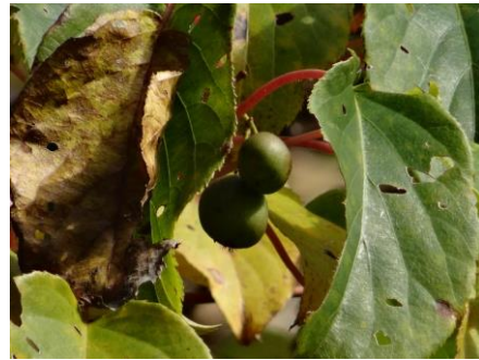
マタタビ科のサルナシ（コクワ）の実