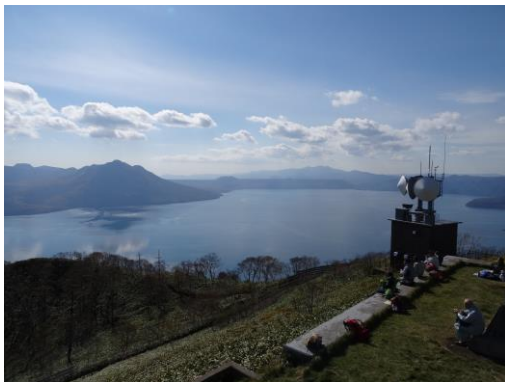
支笏湖を眺めながらの昼食