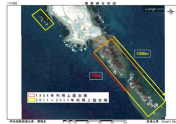
図2 えりも地域の上陸岩礁の拡大