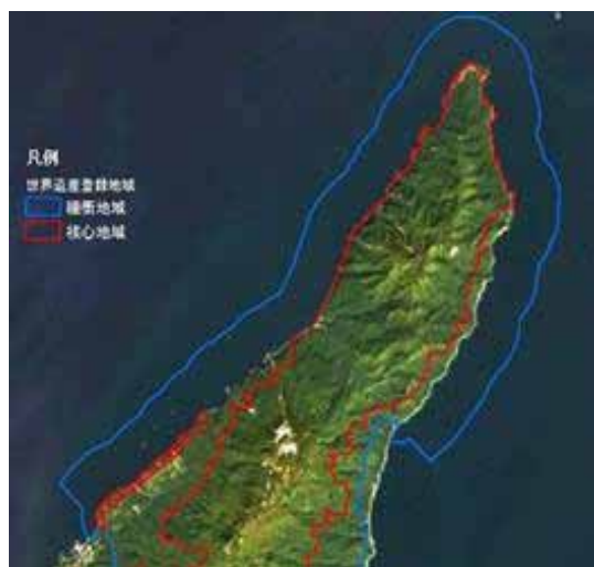
図1：管理対象地域（距岸3kmまで）

遺産地域内海域（図1）における海洋生態系の保全と、持続的な水産資源利用による安定的な漁業の営みの両立を目的とする。