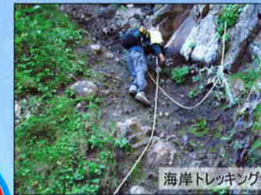
海岸トレッキング

動力船による岬への上陸は 禁止 。 知床岬に徒歩で到達した場合も、 徒歩でお帰り下さい。