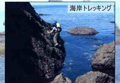
海岸トレッキング