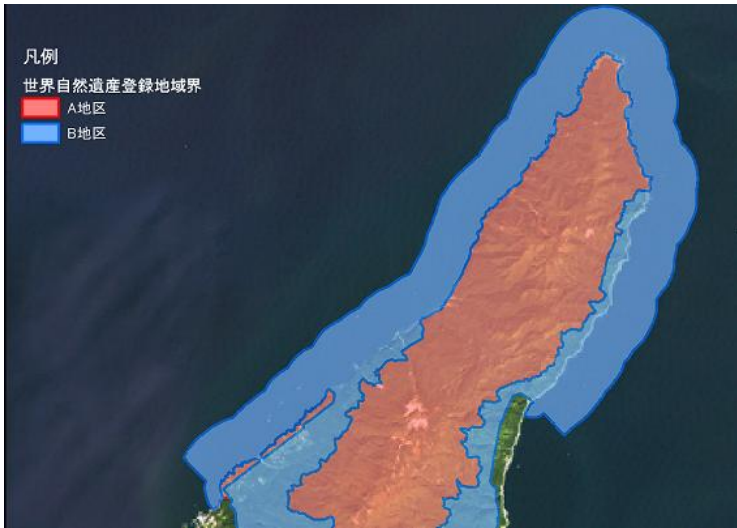
(図 1) 管理対象地域