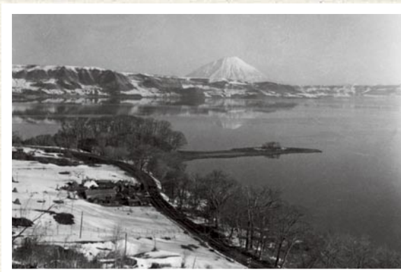
洞爷湖畔 珍古岛附近(1954年)

洞爷湖畔旅游事业的发展起来是因为，在大正时代初期此地发现了温泉，后在大正末期通过这个地方连接函馆和札幌的国铁室兰本线和千岁线被开通。在1929年，从虻田(现JR洞爷)车站到洞爷湖的铁道(在第二次世界大战之中废止)开通，并且相继出现了大饭店和高尔夫球场等。尽管在战前成为指定国立公园的候补对象，但阿寒和大雪山却先被指定为国立公园。在战后因为离札幌近而且被评价为有良好的利用性，在1949年，它有幸指定为国立公园。从1955年到1973年，凭借经济高速增长期的观光旅游高潮共同发展，从而洞爷湖畔终于发展成为观光旅游地。