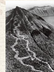
札幌冬季奥林匹克运动会当时的惠庭岳的滑降路线