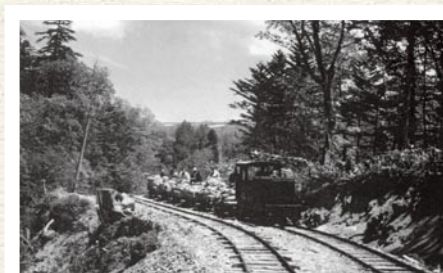
过去在美笛金山的专用铁道(1936年至1951年之间运行)

由于在1972年举行了札幌冬季奥运会，惠庭山成为滑雪滑降比赛的会场。关于为路线设定而决定采伐国立公园的树木在当时就有了争议，但当确定以比赛以后撤除设施并且植树恢复到原来的状态为条件时便同意了采伐，建设了全长超过2公里的男女路线以及架空索道等建筑物。比赛结束之后立刻开始了恢复原状的工作，在不晚于1974年实施了撤除设施及在陡斜面植树等的治山工程。另外随后也长时间进行了保育树木的工作。现在路线的痕迹已相当淡化，但是后来栽植的树木与周边的树林相比还是比较小。