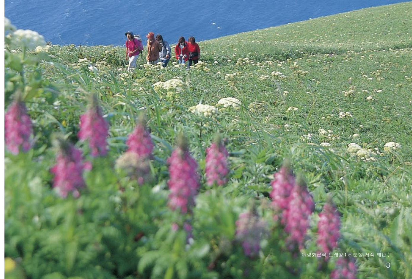
아생화군락 트레킹 (레븐섬 서쪽 해안)

해면에서부터 우뚝 솟은 높은 산, 완만한 곡선을 그리는 언덕, 그리고 넓은 벌판 . . . 이 국립공원은 짧은 봄에서 여름까지 어디를 가도 꽃들로 가득 차 있다.