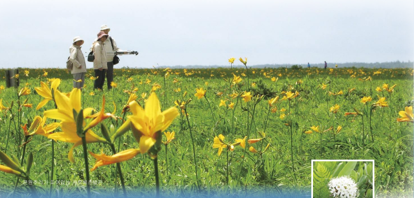
큰원주리가 피어있는 사로베초밭