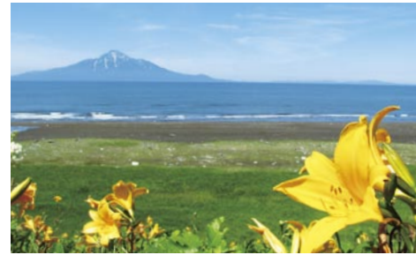
사로베츠 해안에서의 리시리산