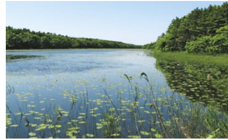
고요한 사구림의 풍경이