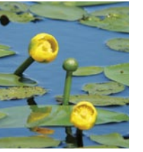
왜개연못 (Nuphar pumilum)

사로베츠 별판과 바다사이에는 사구림이 펼쳐져 있다. 연장 40km 에 걸쳐서 수열의 사구가 해안선과 평행을 이루고, 사구와 사구 사이의 저지대에는 습지와 작은 못이 이어져 이곳 이외에서는 잘 볼 수 없는 경관으로 심오한 원시성을 느낄 수 있다. 왓카사카나이 (稚咲内) 등에서 일주하는 것이 가능하지만, 보도가 불명확하여 길을 잃을 수 있기 때문에 지역의 가이드 등과 동반할 것을 권한다.