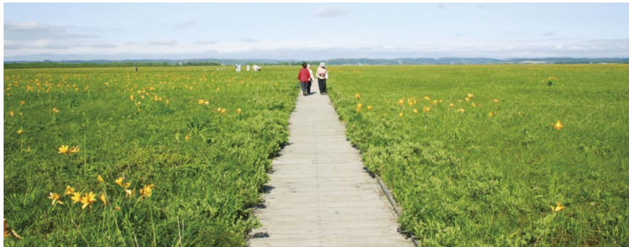
가시원추리가 핀 사로베츠습원

또, 호로노베 (幌延) 방문객 센터의 앞부터 목도를 걸으면, 습지식물 외, 남개연과 순채등의 수생식물을 볼 수 있다. 새는 초원성 종 외, 나가누마 (長沼), 펜케연못, 판케연못과 주변의 농지에서는 철새이동 시기에 많은 물새가 모인다.