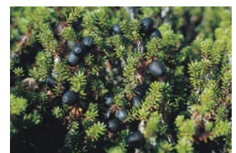
ガンコウランの実

礼文岳は標高490mで礼文島の最高峰である。標高は低いが、山頂一帯はハイマツ、ガンコウランなどの低木林で、本州中部の高山帯そのままの雰囲気である。山頂からは礼文島全体が眺められ、サハリンも見える。