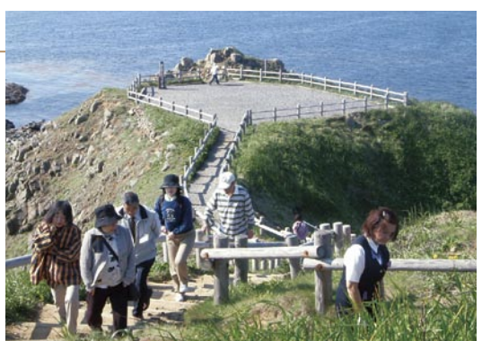
スコトン岬の展望台

久種湖は砂丘によって海から隔てられた60haほどの湖沼で、南岸に湿原があり、木道が敷かれている。春にはミズバショウ、初夏にはクロユリが咲く。湖畔にはキャンプ場がある。