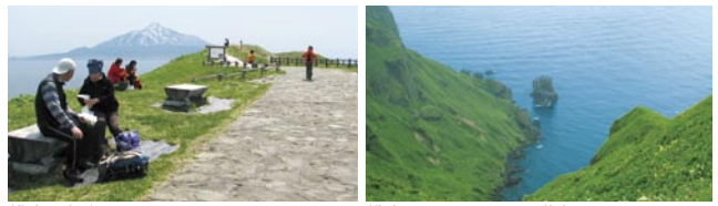
桃岩展望台 桃岩コースから見た猫岩

桃岩は桃のような形の岩で、桃岩展望台から一望できる。マグマが冷えて固まったものであり、表面にはタマネギの皮のような割れ目(板状摂理)が重なっているのが見られる。桃岩展望台までは香深から歩いて行けるが、展望台手前のレンジャーハウスまでは歩道と別に車道もある。桃岩展望台から元地灯台までの西斜面一帯がお花畑となる。トレッキングコースは南端の知床まで続いている。