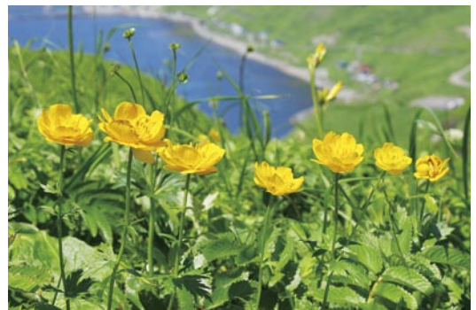
桃岩コースのお花畑