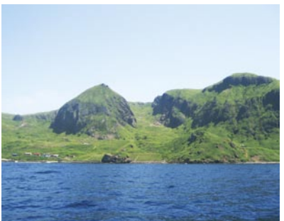
海上から見る桃岩