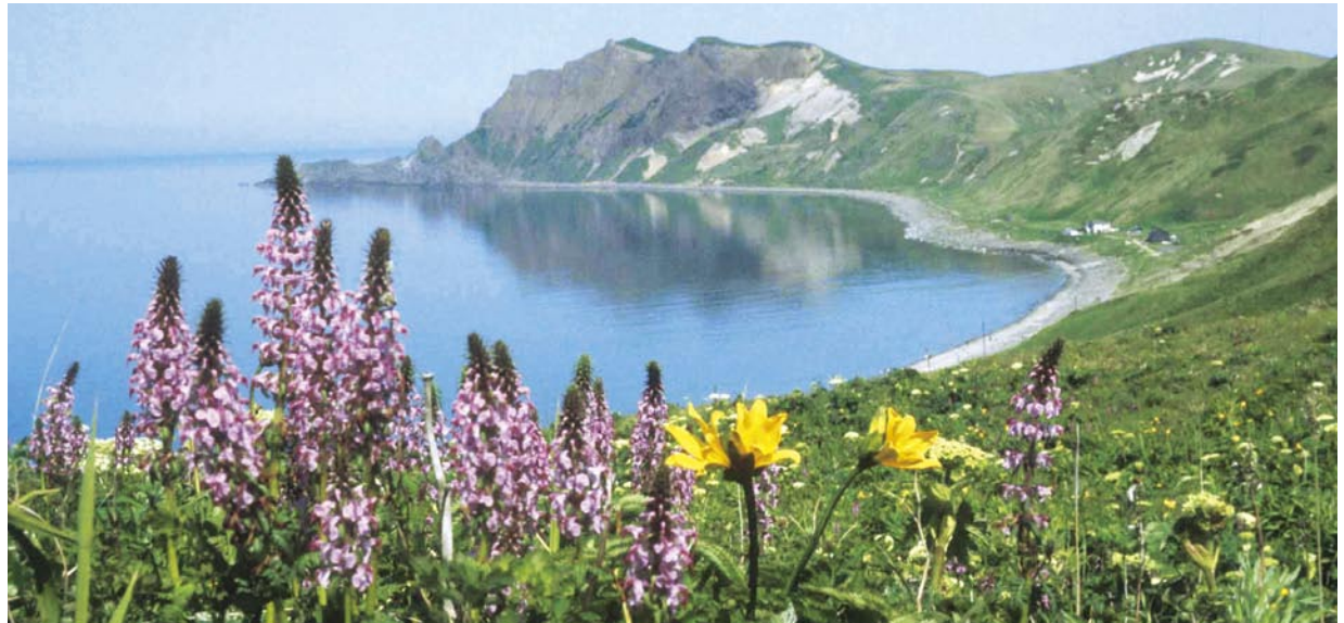
お花畑の続く4時間コース