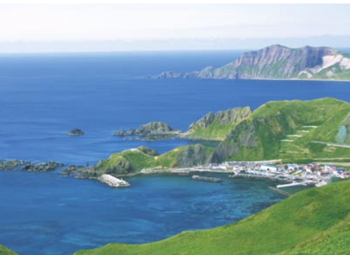
西海岸を望む(澄海岬とゴロタ岬)

島の西岸は海食崖が発達しているが、陸上から全貌を見渡すのはむずかしい。元地園地からは、地蔵岩、猫岩が展望できるとともに、背後には桃岩がそびえ立つ。波の穏やかな日なら、シーカヤックによる探勝も可能だ。