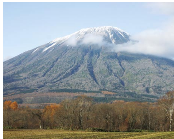
晚秋的山羊蹄山 (由真狩側)