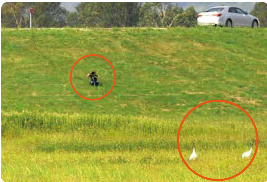
写真左：人がタンチョウに接近。この後警戒したタンチョウは飛び去る。(2016年9月)