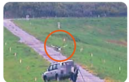
写真右：接近した車から人が降りたため、警戒したタンチョウが飛び去る。(2017年9月)