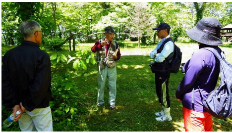
ミズナラについて