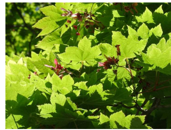
カエデ科のハウチワカエデ