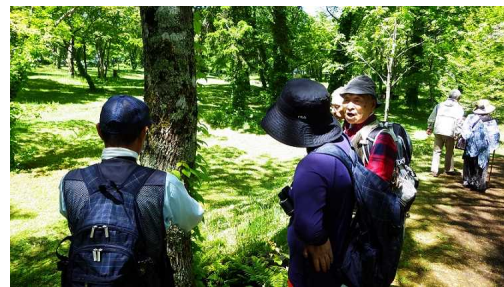
ツタウルシの解説中