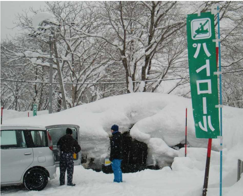
パトロール風景② (パンフ配布)