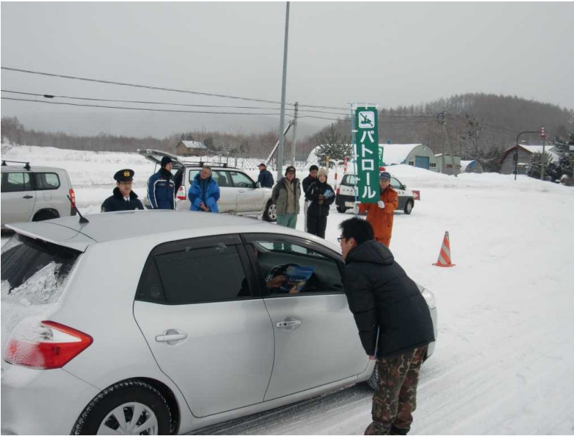
パトロール風景① (パンフ配布)