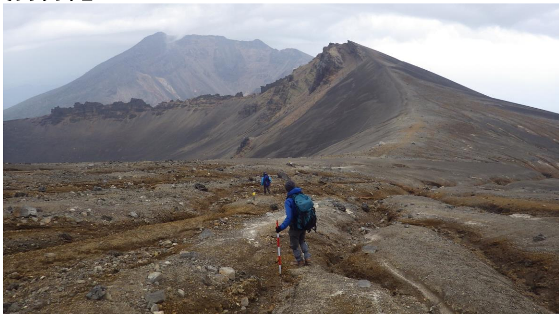
十勝岳東側稜線から美瑛岳方面