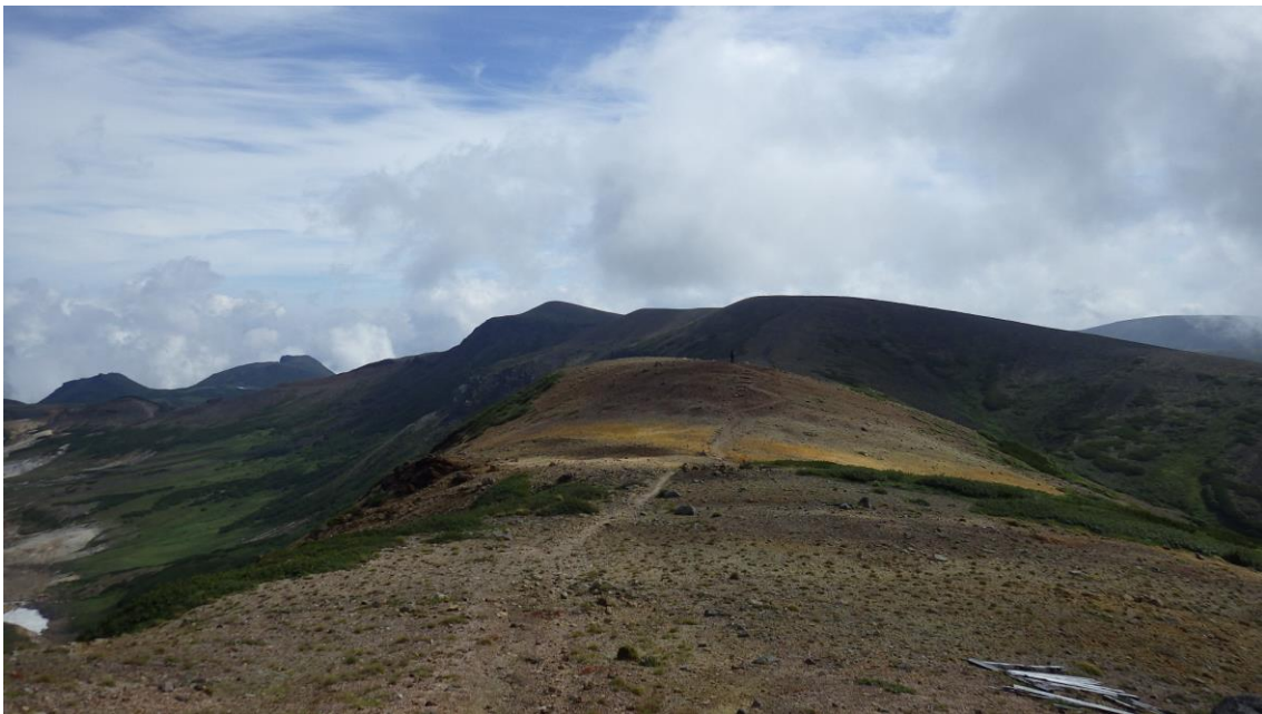
松田岳付近から北海岳方面