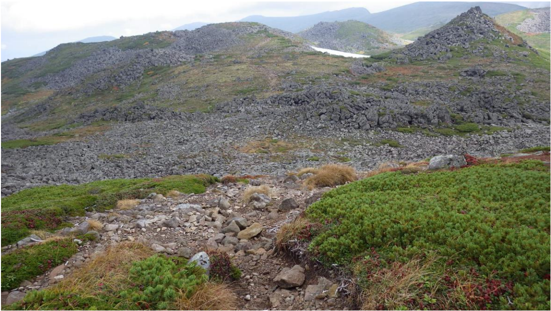
ロックガーデン付近北側