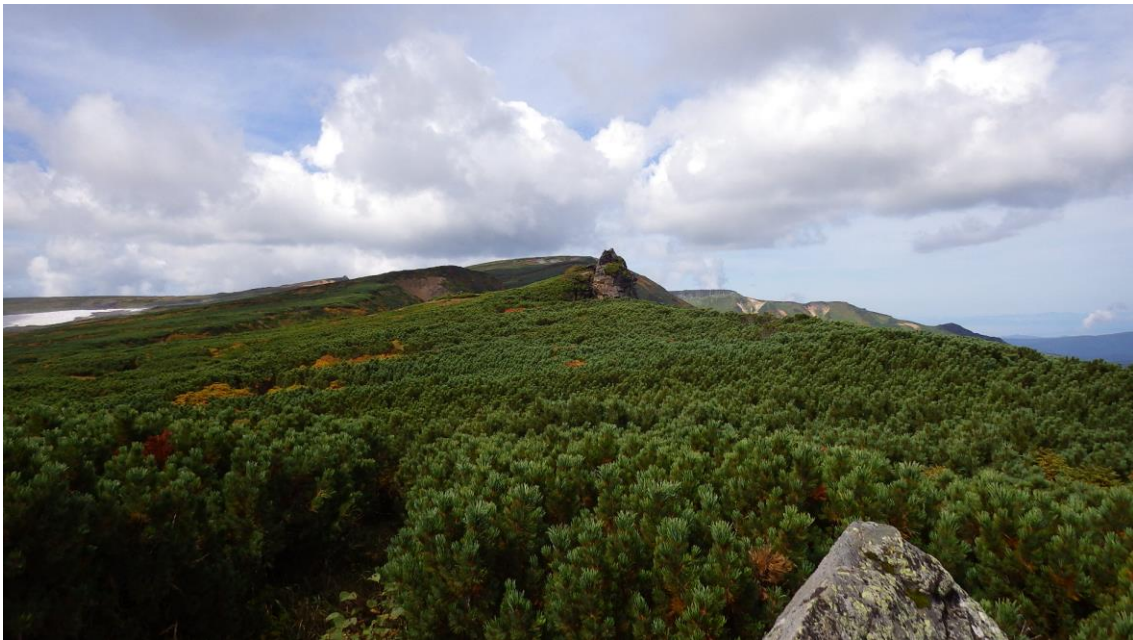
五色岳付近から化雲岳方面に続くハイマツ帯を通る道