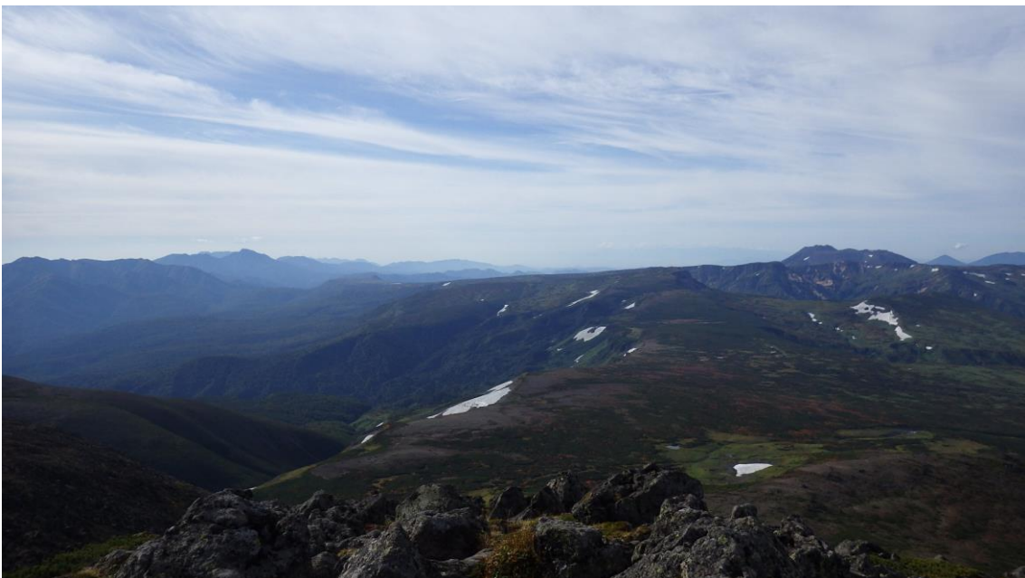
白雲岳山頂から平ヶ岳・トムラウシ方面