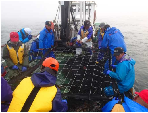
格子網の装着状況(H27)