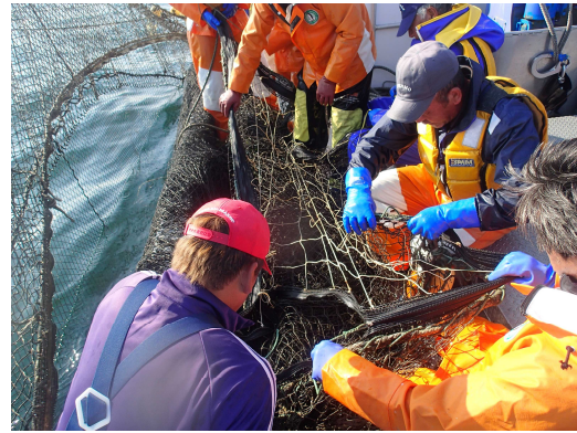
ファスナーによる格子網の着脱(H27)