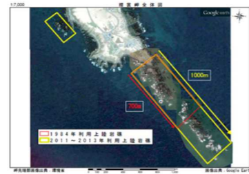
図2 えりも地域の上陸岩礁の拡大