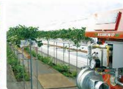
育苗用ハウスでの保温