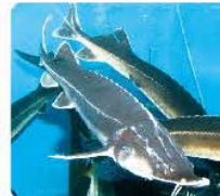
チョウザメ飼育施設