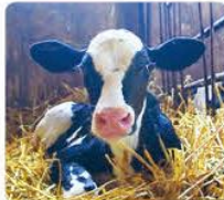
町内個別畜産農家