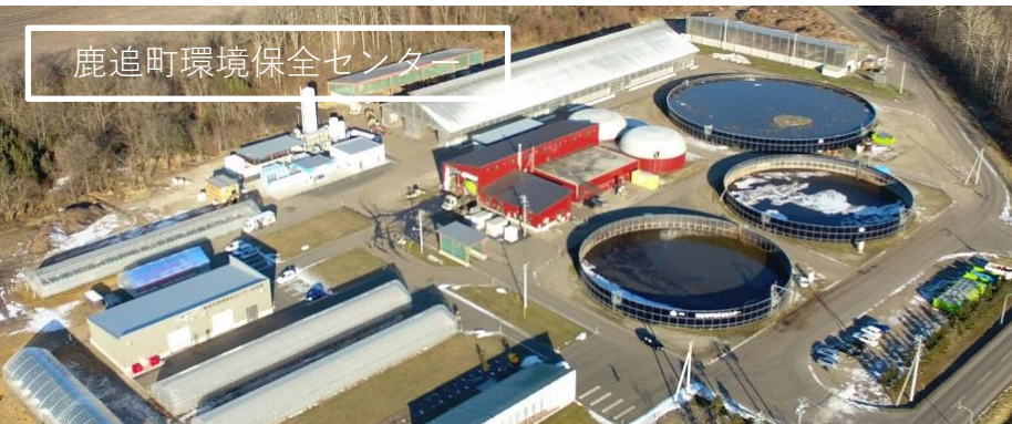
鹿追町環境保全センター

鹿追町環境保全センターの後にできた瓜幕バイオガスプラントは原料となる家畜排せつ物等の処理能力を大幅にアップし、未来へ向けさらなるエコエネルギーづくりに邁進しています。