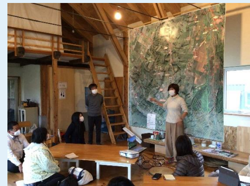
北海道ブロック中間共有会（余市 11/15）