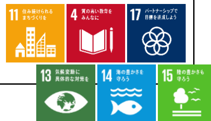
目標に関わる主なSDGs

「地域循環共生圏」づくりに向けて、道内各地で対話や学習、協働による実践が進み、複数の地域や事業において、先進的なモデルが形成されている。