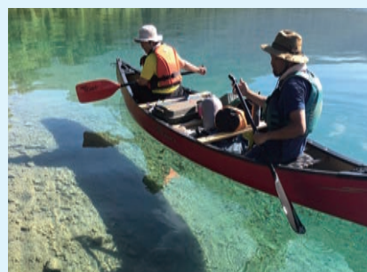
カヌーでのゴミ拾い