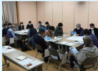
支笏湖の適正利用の検討