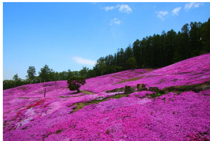
日本一の芝ざくら 5月上旬～6月上旬