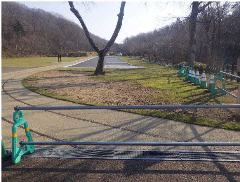
駐車場 遠景（西側より）