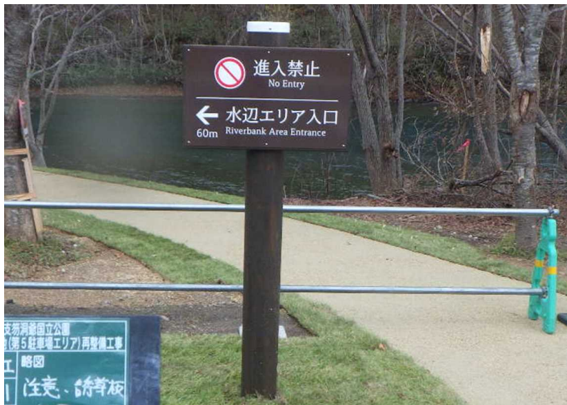
サイン類 注意・誘導板(固定式) 侵入禁止など