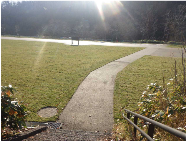
芝生広場 近景（西側トイレ横）