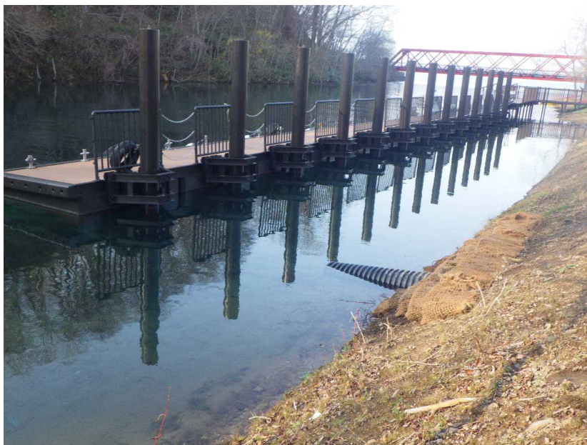
排水設備 ヤシ土嚢の開口部