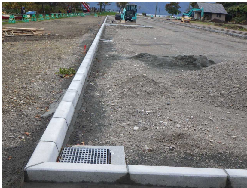
排水設備 集水升（河畔ヤード付 近）