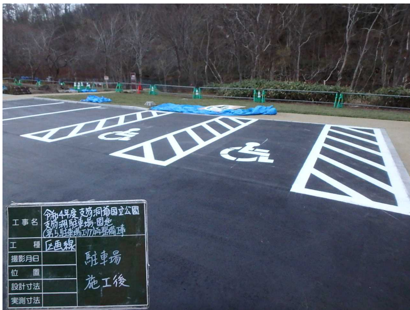
駐車場 車いす用駐車場