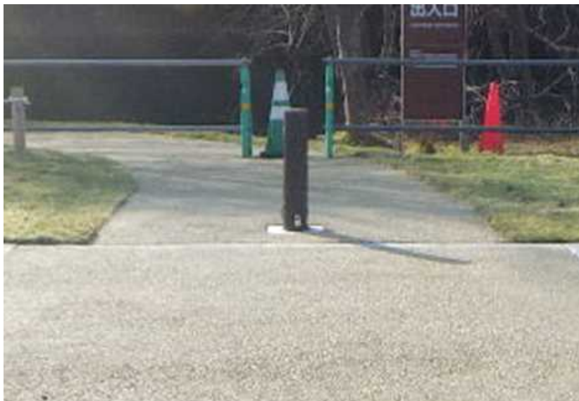
その他管理施設 車止め（西側アプローチ 路）