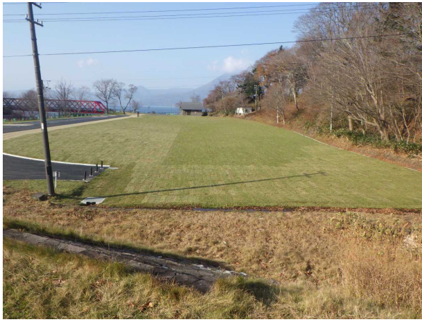
芝生広場 全景（東側より）