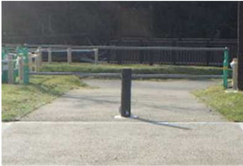
その他管理施設 車止め（東側アプローチ 路）