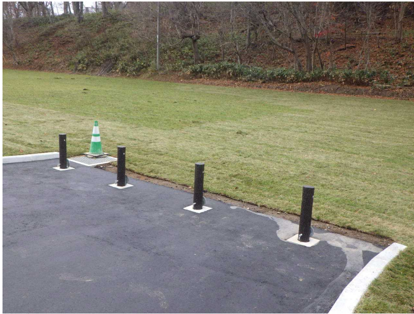
その他管理施設 車止め（芝生広場入口）