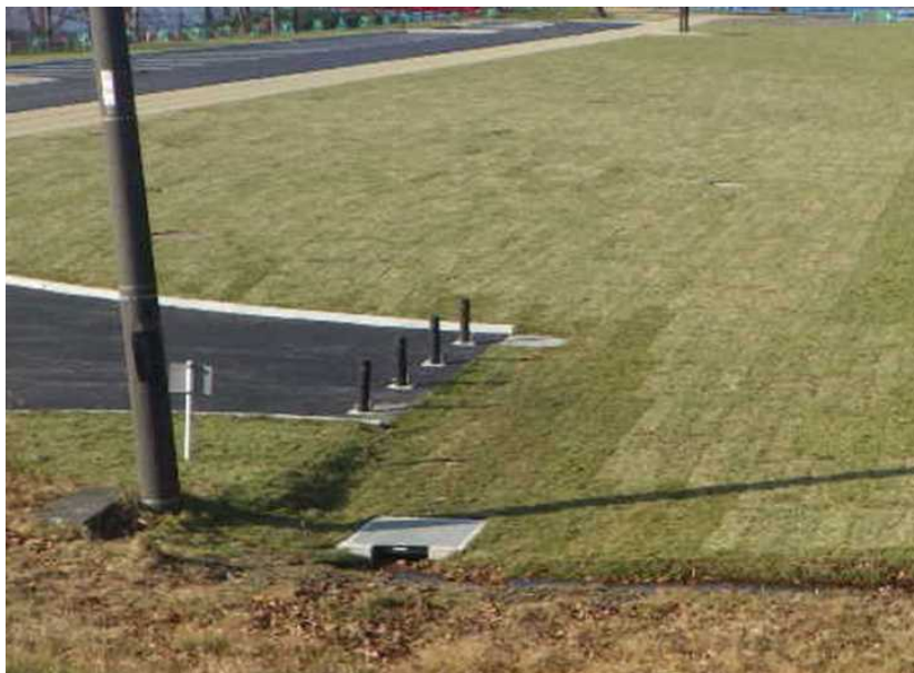
排水設備 芝側溝の流末集水升