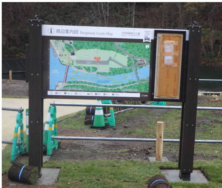
サイン類 案内板(掲示板付) 周辺案内図