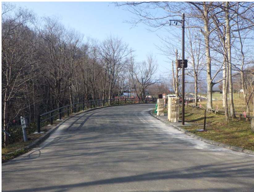
その他管理施設 ガードパイプ