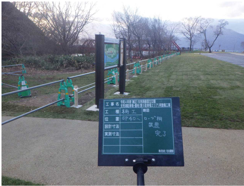
その他管理施設 ロープ柵