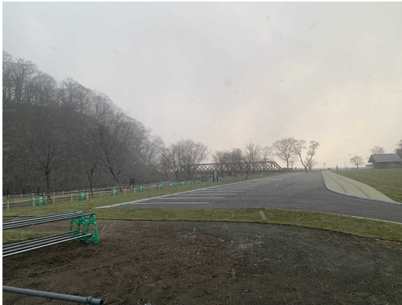
駐車場 遠景（東側より）