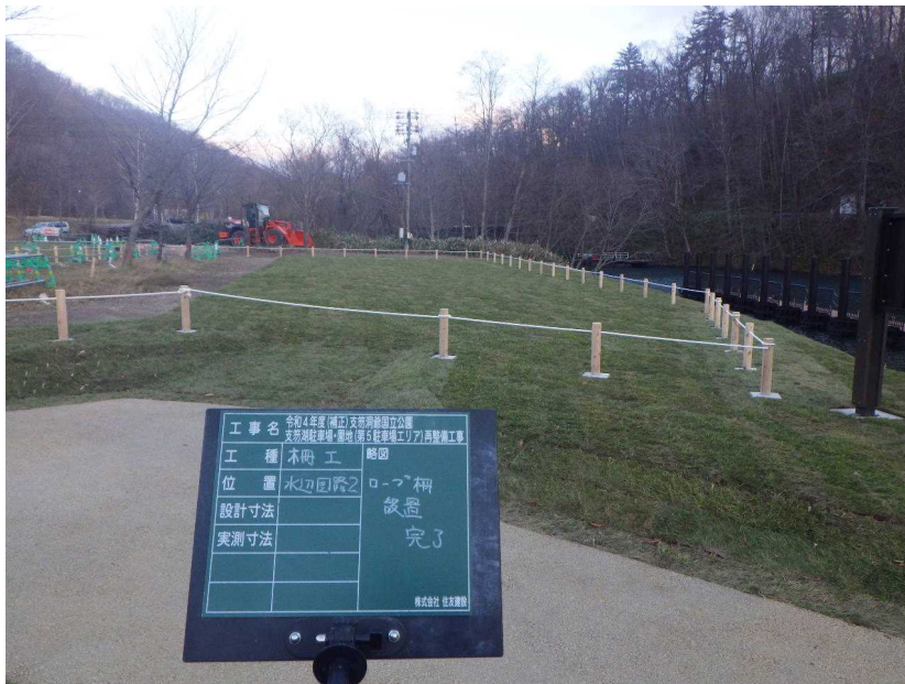
河畔ヤード 入口部