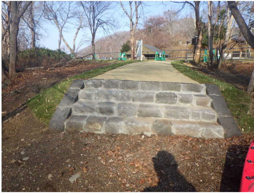
親水エリア（アプローチ路） 西側（階段部分）