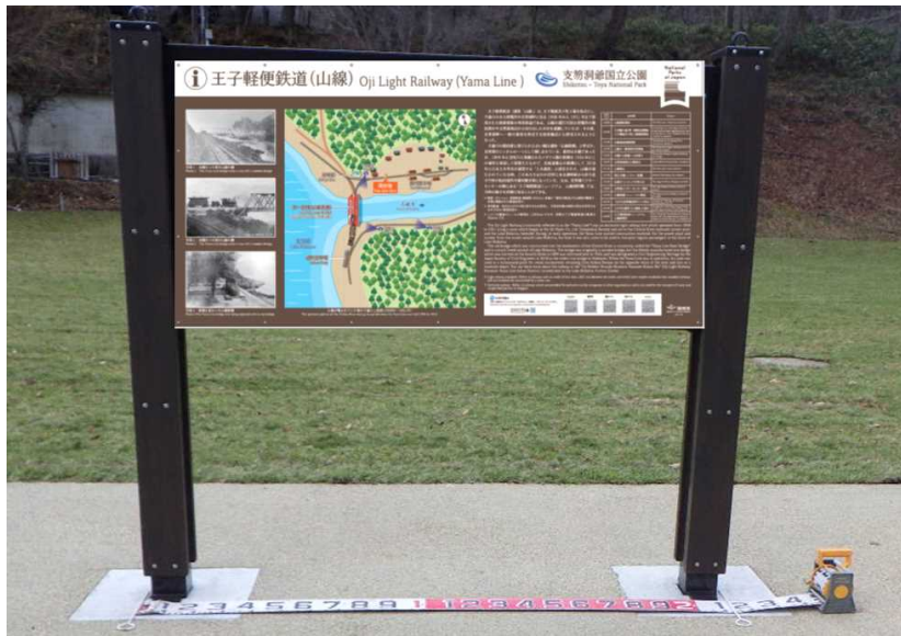
サイン類 案内板(脱着式) 山線