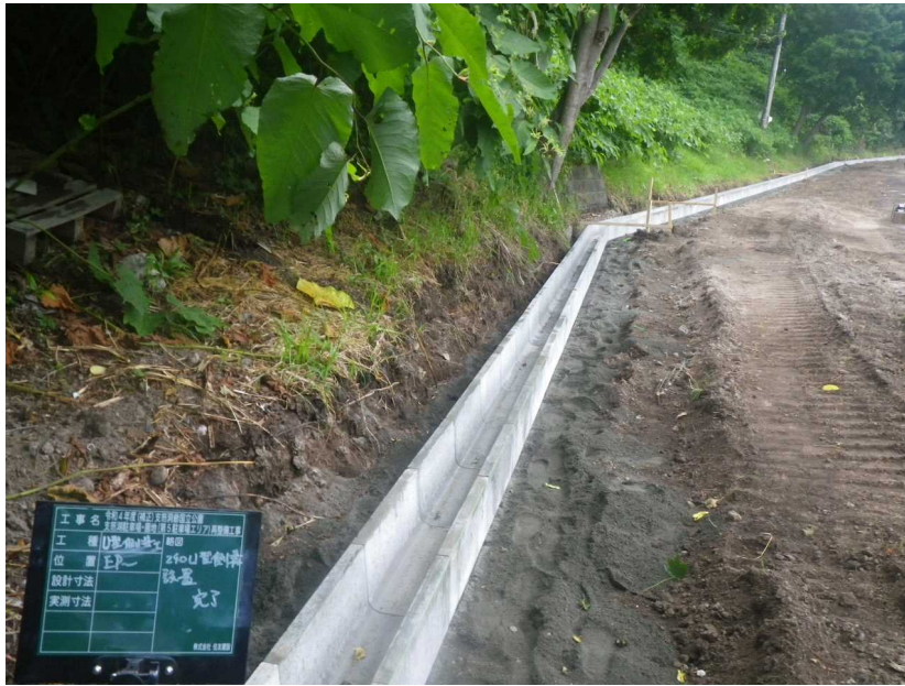
排水設備 山側U字側溝