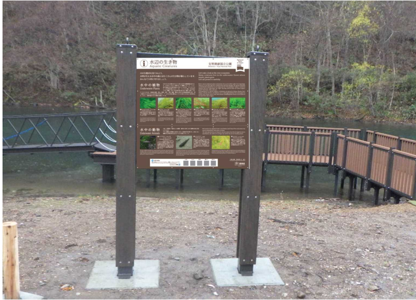
サイン類 説明板(脱着式) 水辺の生き物