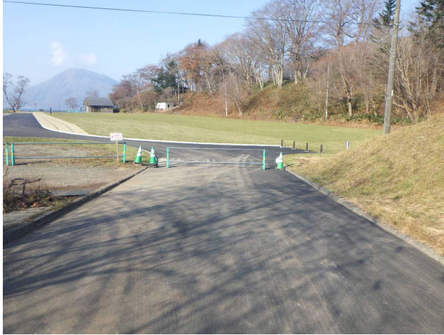
芝生広場 全景（取付道路より）