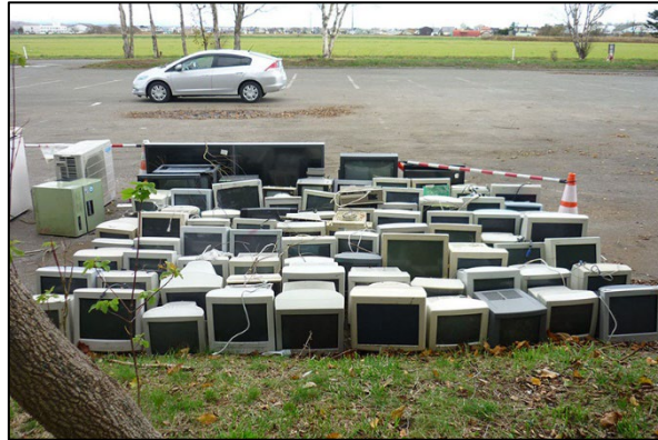
図 1-2 便乗ごみとおもわれるもの（平成 30 年北海道胆振東部地震） 3

搬入されたごみが便乗ごみであるかどうかの判定は簡単ではありませんが、水害時に持ち込まれる浸水の痕跡が明確でないものや、通常一般家庭から排出されることはない大量の廃棄物は便乗ごみの可能性があります。