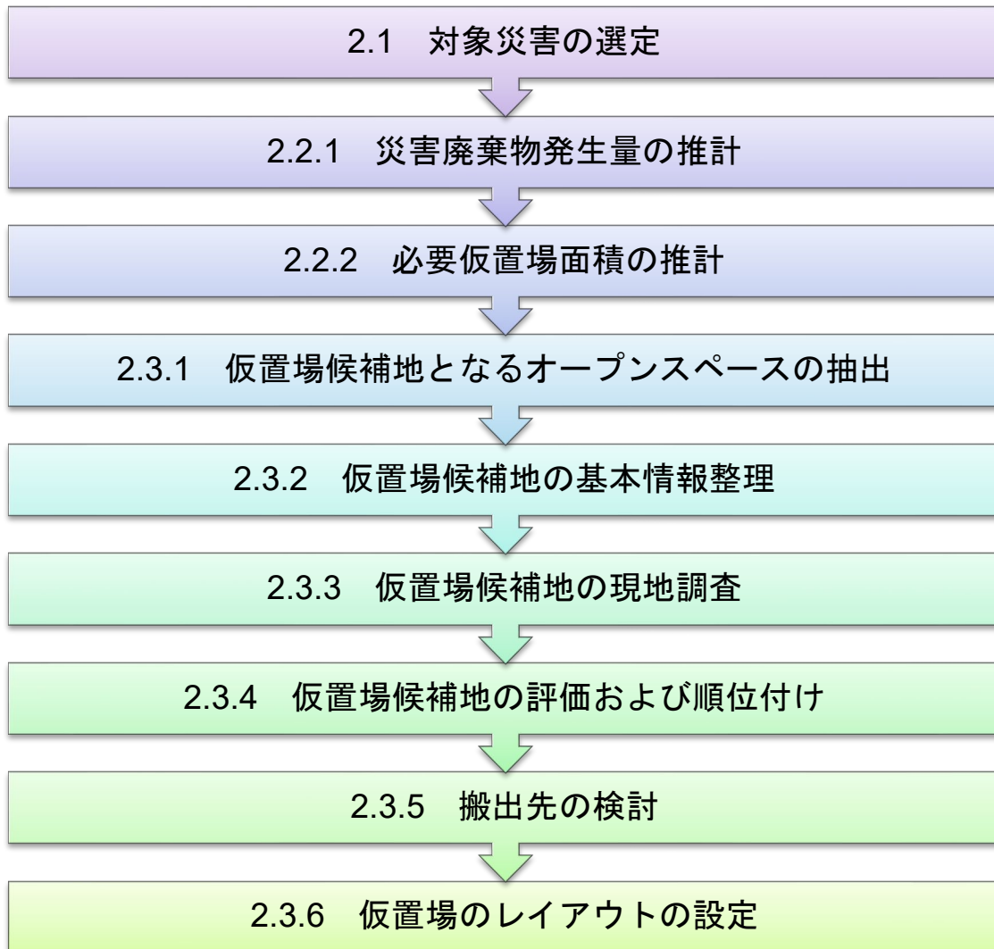
図 2-1 仮置場の選定フロー