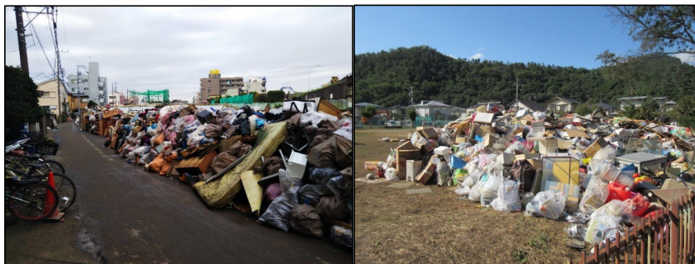
図 1-1 路上や公園が勝手仮置場となった事例（令和元年東日本台風） 2

特に水害の場合は、地震等に比べると生活再建に向けての動きが早い傾向にあり、水が引いた直後には浸水した家屋から早期に片付けごみが排出されます。そのため、次項に記載する仮置場の開設が遅くなると、住民が自然発生的に片付けごみを排出し、混合状態のごみの山ができてしまい（住民によって勝手に集積された場所を「勝手仮置場（勝手集積場ともいう）」と呼びます、図 1-1）、被災市町村の処理費用負担の増大につながります（なお、被災家屋をリフォームする際に生じる建設系廃棄物は、産業廃棄物として請負業者に処理の責任があります）。