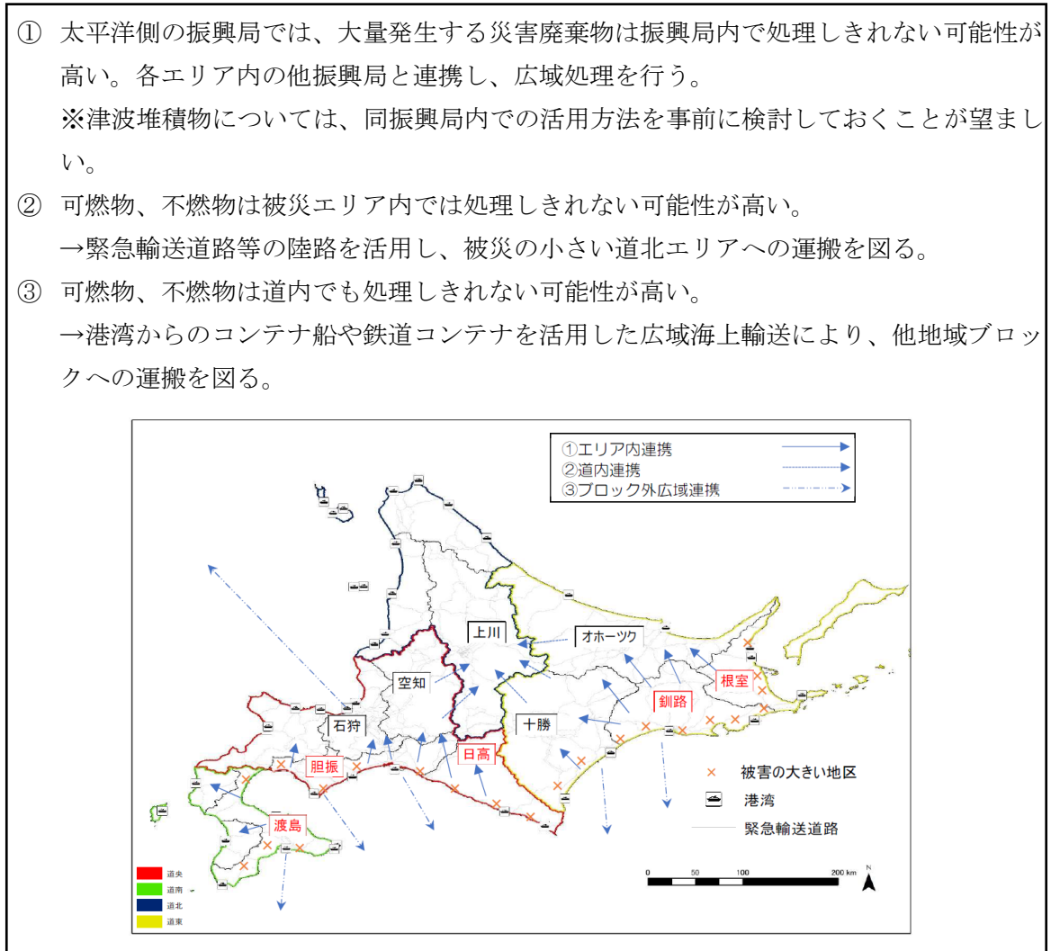
図 2-3 日本海溝・千島海溝沿いの巨大地震発生時の災害廃棄物処理の広域連携のイメージ 35

参考として、日本海溝・千島海溝沿いの巨大地震発生時の災害廃棄物処理の広域連携のイメージを図 2-3 に示します。