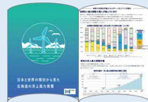
R5年度作成冊子イメージ

洋上風力発電設備導入に向けた取組が加速するよう、洋上風力発電の仕組み、留意点や国内、国外の導入事例等に関する冊子を作成し、海域を有する市町村に配布します。