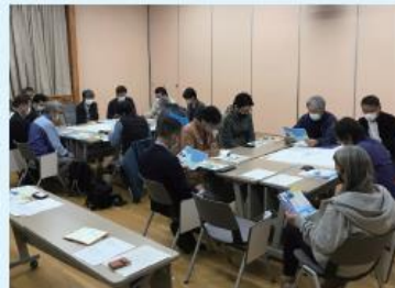
支笏湖の適正利用の検討に関する会議の開催