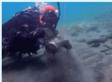
湖底清掃