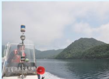
エリアパトロール