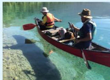
カヌーでのゴミ回収