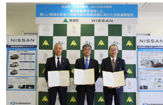
日産自動車(株)との協定