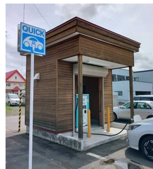
道の駅びえい「丘のくら」に設置しているEV充電設備