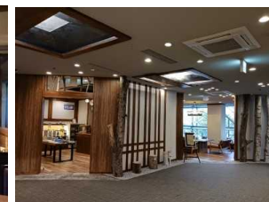
空調の設備更新や照明器具のLED化でCO 2 削減した施設