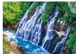
大雪山国立公園内 白ひげの滝