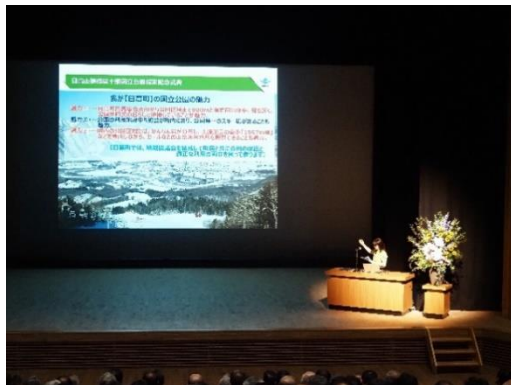
山北自然保護官（当時）による本国立公園の紹介