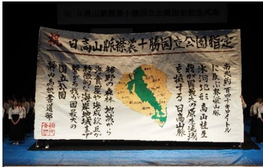
静内高等学校による書道パフォーマンス