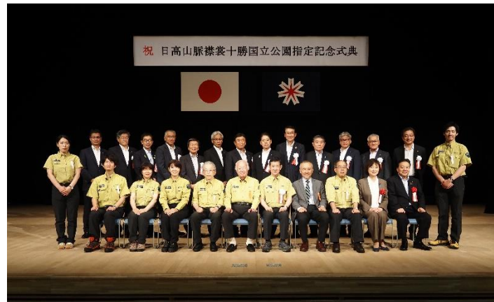
主催者及び来賓の記念撮影