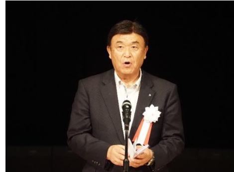
大西日高町村会長による歓迎挨拶