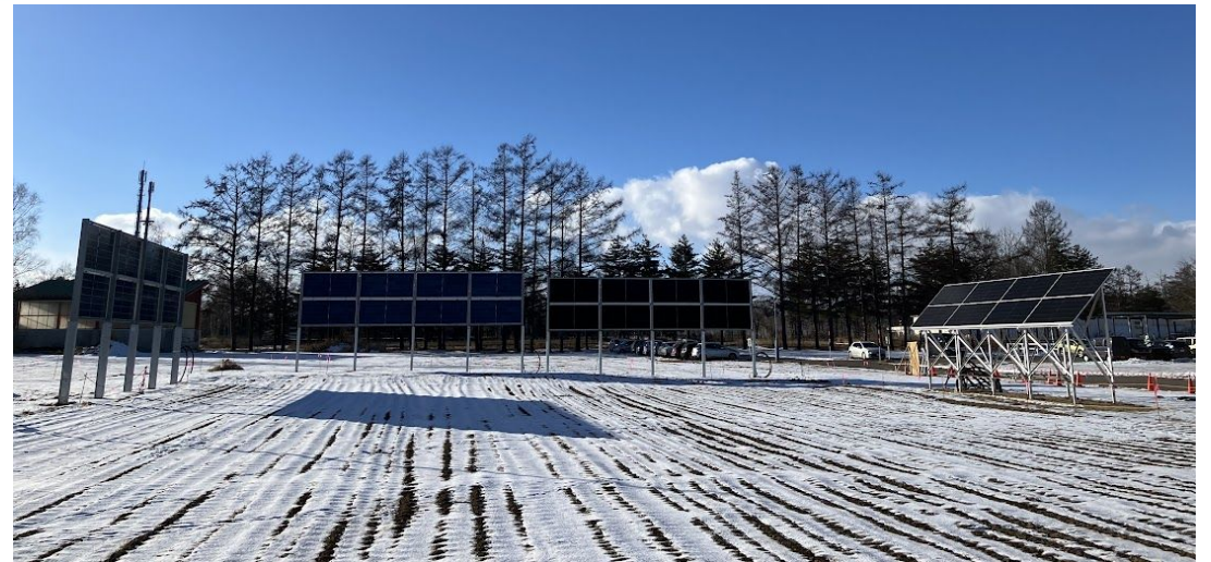
帯広市 帯広畜産大学(PPA自家消費)