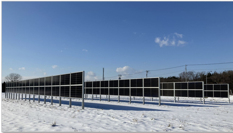
江別市 酪農学園大学(PPA自家消費)