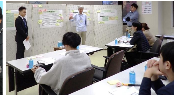
((2)③七飯町 意見交換会の様子)