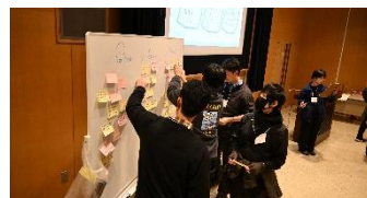
((1)① 共有タイムの様子)