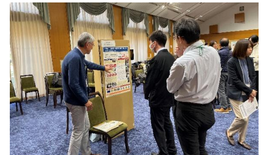
((2)① ポスターセッションの様子)