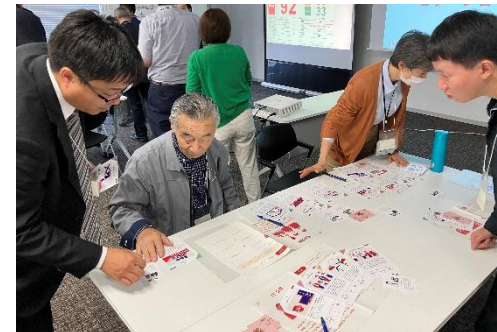
((2)②苫前町 ワークショップの様子)