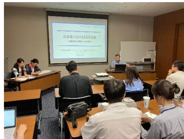
((1)① 日韓学術文化交流事業訪日団への出講)