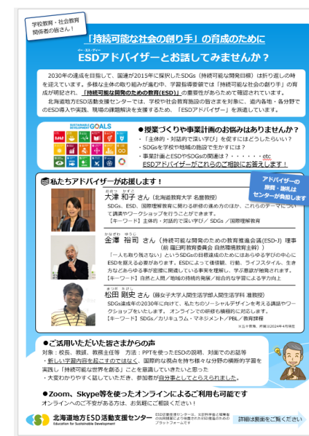
(アドバイザー制度紹介フライヤー)