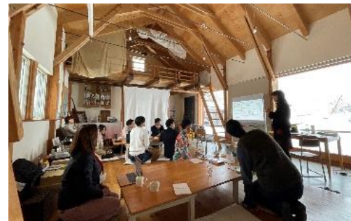
((1)④ Well-being研修検討会の様子)