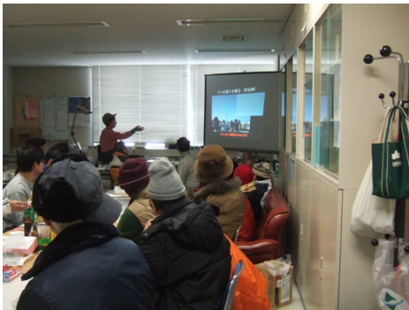
講師による宗谷の動植物の解説