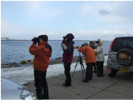
埠頭における観察