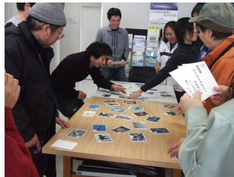
野鳥カルタを楽しむ