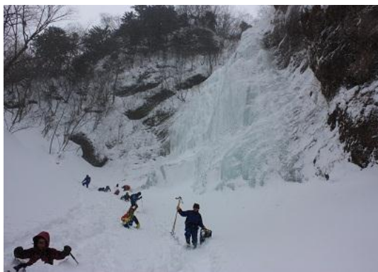
下りは尻滑りもよし、つぼ足で下りるのもよし、各自好きなスタイルで下ります。