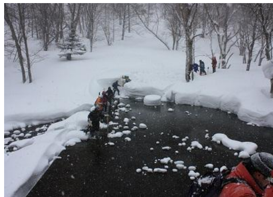
途中でニセイノシキオマップ川を渡ります。