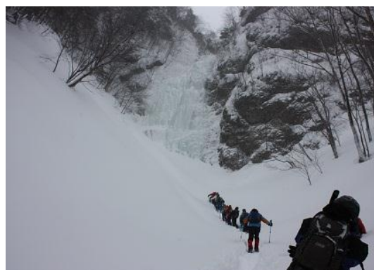
ブルーウルフまであと少しだけど、最後の登りがキツイです。