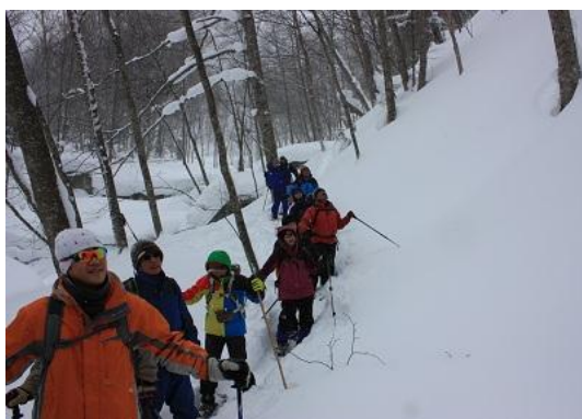
河畔林で樹木を見ながら・・・。