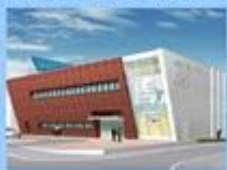
どろぎんカーリングスタジアム