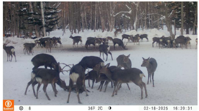
〈写真2. 餌場のシカ誘引状況〉 (数十頭等誘引)