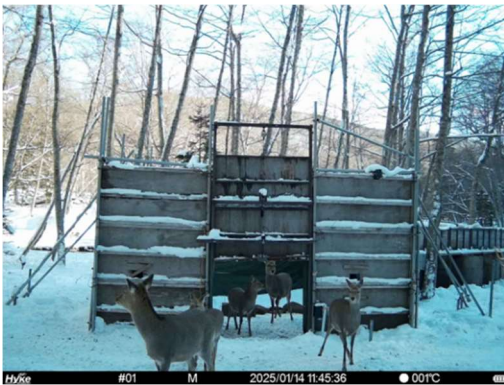
〈写真1. ワナ付近の誘引状況〉 (数頭から十頭程度誘引)

しかしながら、シカの出没エリアをワナのみで対応するには、ワナ数が不足しているとの判断のもと、樹木の食害防止対策として6箇所の餌場を設定し給餌も併せて実施した。これまでも同様の傾向ではあるが、餌場により多くのシカが集まる傾向がみられた。