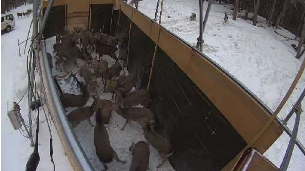
<写真3. (2月9日、27頭) 捕獲時ワナ内状況>

令和8年1月13日(火)より捕獲を実施し、2月24日(火)までに、19日間捕獲を実施した。