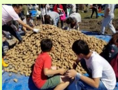
足寄町農協青年部 (足寄町) 足寄産野菜詰め放題