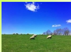
石田めん羊牧場 (足寄町) 羊の食べ比べ串 愛寄牛、短角牛