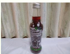
矢野農園 (足寄町) あしよろのカシスサイダー