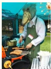
陸別ういる (陸別町) フランクフルト (陸別ゲレゼ工房)