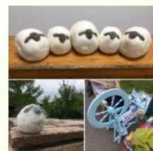
わたしはひつじ (帯広市) 羊のマスコットづくり 羊毛製品