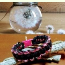
Handcraft if (足寄町) ハーバリウム制作体験