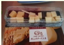
JAあしよろ あしよろチーズ工房 (足寄町) チーズ盛り合わせ