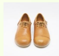
EZO LEATHER WORKS (池田町) BUFFA (エゾシカ革ハンドメイドシューズ)