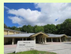
エコミュージアム センター (釧路市) 自然解説・展示 グッズ販売