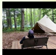
Feet Meet (足寄町) キャンプ用品展示