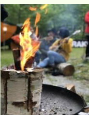
岐志会 (足寄町) ウッドキャンドル焼きマシュマロ 薪割り体験