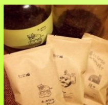
暮らしと珈琲 みちみち種や (石狩市) ホッカイドブレンド