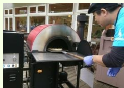
マルショウ技研 & 満寿屋商店 (足寄町・帯広市) ピザ(十勝産小麦)