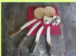
ソコノキ (むかわ町) バターナイフづくり