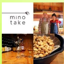
minotake (札幌市) 自然派ワイン(赤・白・ロゼ)