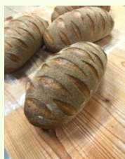
boulangerie 廻りみち (当麻町) パンコンプレ・ハード系パン