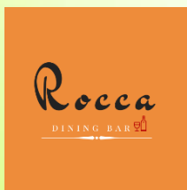
ダイニングバー Rocca (足寄町) 鹿肉を用いた温まる料理