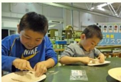
足寄動物化石博物館 (足寄町) ミニ発掘体験