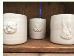
野村亜土 (足寄町) 切り立て湯呑み (動物モチーフ)