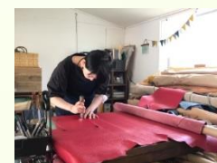
Yoshida Leather Works (幕別町) ねずみのポーチ 革製品、羊革