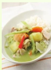
ふきのしたのキッチン (足寄町) 森のコロコニカレー (ラワンふきのカレー)