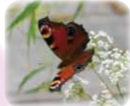
花とクジャクチョウ