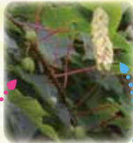
128 ヤチダモ雌株(果実)