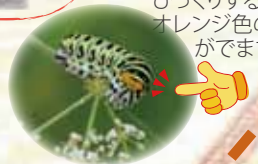
キアゲハ(終齢幼虫) さなぎで越冬