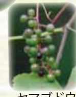
ヤマブドウ まもなく真っ黒色に