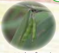
108 ヤブマメ この豆花以外に地下茎の先に閉鎖花をつけ結実