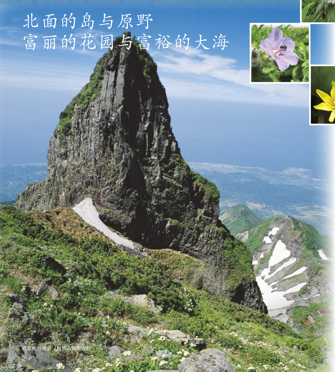
屹立的蜡烛岩（利尻山顶附近）