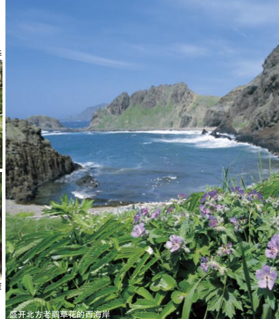
盛开北方老鹳草花的西海岸