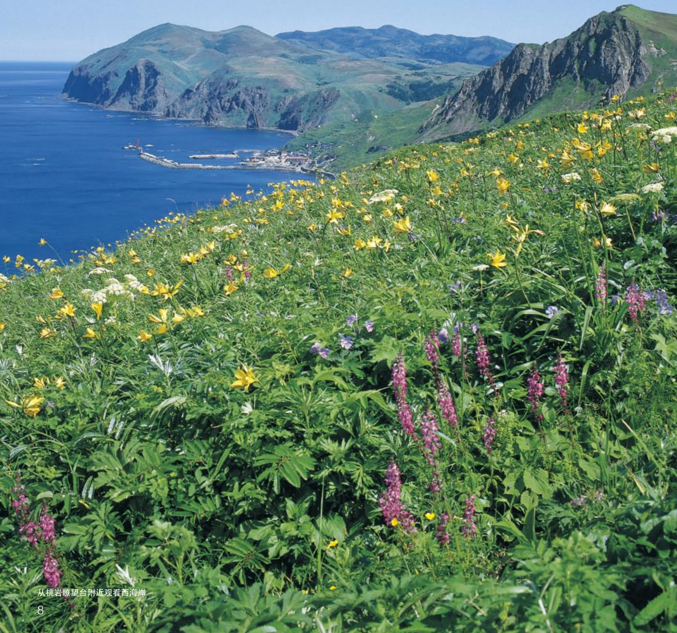
从桃岩瞭望台附近观看西海岸

礼文岛位于利尻岛的西北，距离大约8公里的地方。礼文岛的东西长大约5公里、南北长大约20公里，相比于利尻岛，是非火山性细长岛。岛的整体是丘陵状的地貌，礼文岳最高点的海拔为490米。因为东侧是面向于海岸并缓缓地倾斜，同时西海岸多数是断崖，所以为村落集中于东海岸，在其北部有堵截湖的久种湖。