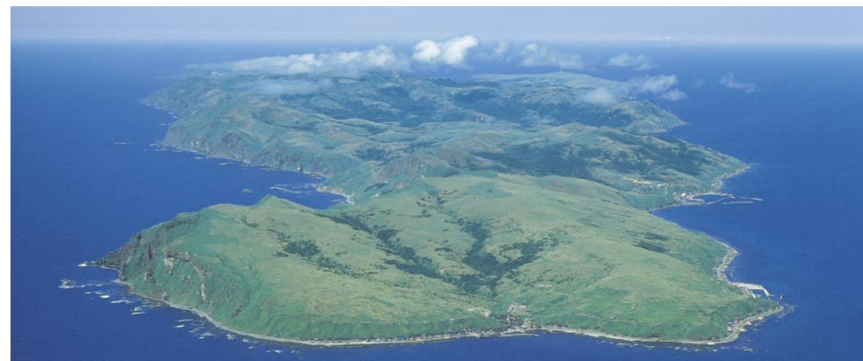
从南部上空鸟瞰礼文岛（左：西海岸、右：东海岸）

南北向长的礼文岛，其东西两边有明显的不同，西侧的海面因为冬季风力强且海食崖发达，断崖上的斜面因强风无法积雪成为草原，并且各种鲜花竞相开放。另一方面，在东海岸，因为冬天的季风没有象西海岸那样强烈，所以存在着人们可以在那儿生活的村落。在段丘的斜面上扩展着细竹原。