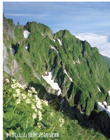
利尻山顶附近的岩峰

位于山麓的姬沼和奥塔多马利泽，还有几个“朋山”（“朋”是阿伊努语小的意思）是爆裂的火山口的遗迹及侧火山。从利尻山出来的险峻的山谷，山麓都形成宽阔的扇形地，告诉人们山顶部剧烈的侵蚀。雨水伏流，河川少可说是这个岛屿的特征。相对而言，泉水很多。泉水在沿岸的海中也有，滋养着渔场。