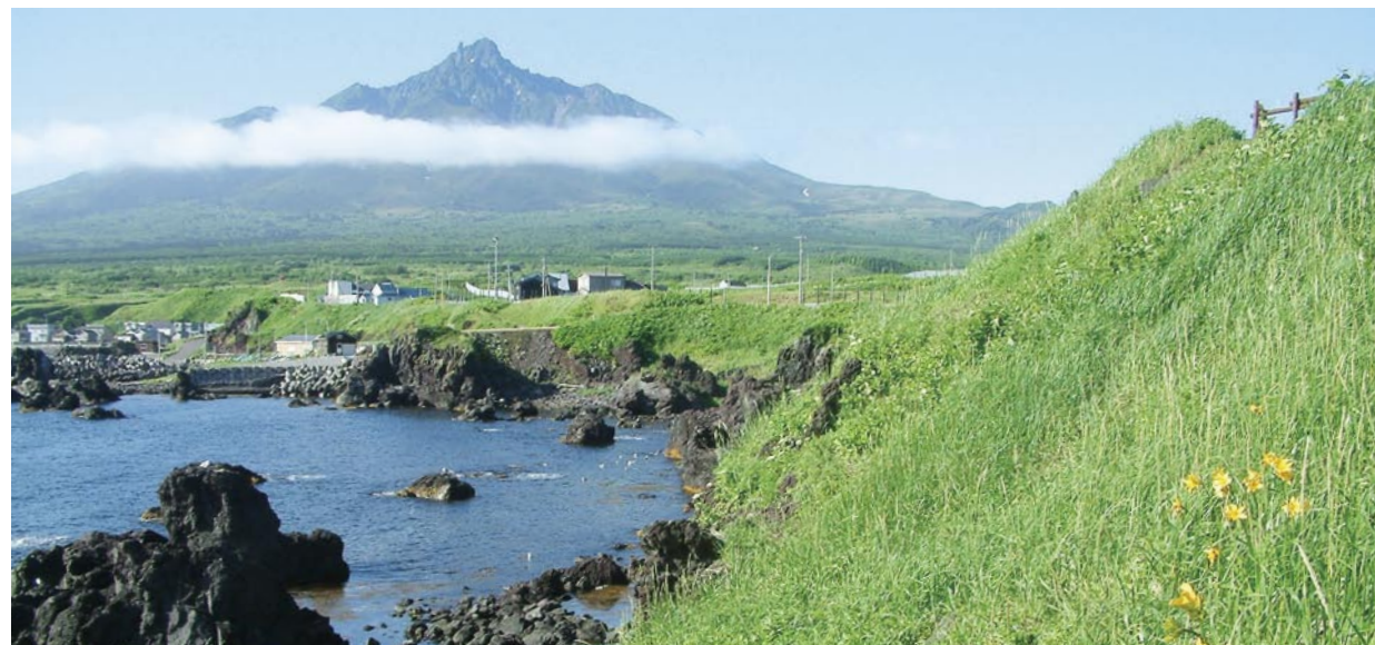
从仙法志海岸观看利尻山

在南端的仙法志御崎，西岸的沓形岬等，可以看见流入海的溶岩等奇岩，也可以在海岸游玩。利尻山的展望也很好。