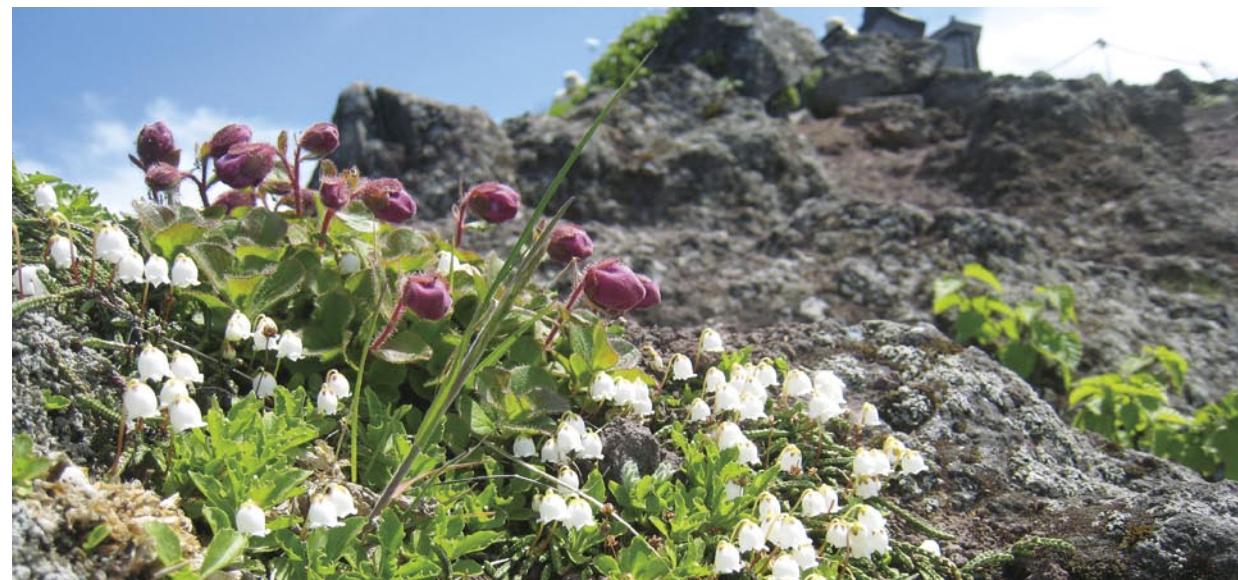
沿着登山道开花的岩须和蝦夷杜鹃（花蕾）

登山道从利尻岛北岸的鸳泊和西岸的沓形开始，从鸳泊的港口开始的路线的利用者比较多。两个路线都需要登山时间约为 10 小时。可以享受只有海上的独立峰才能有的眺望。但是，山顶附近山体的崩落激烈，崩塌的斜面以及狭窄的山脊连续不断，要谨慎行走，注意落石和滑落。到达山顶标高 1719 米的北峰为止就禁止通行了。还有，对于沓形路线，从三眺山开始，上部有好几个危险场所，面向上级的登山者。另外，在利尻山登山时为了不要伤害自然请遵守利尻的规则（请看 16 页）。