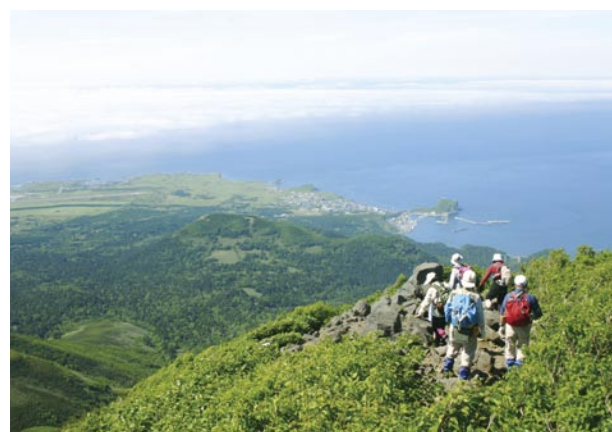
从利尻登山道观看鸳泊