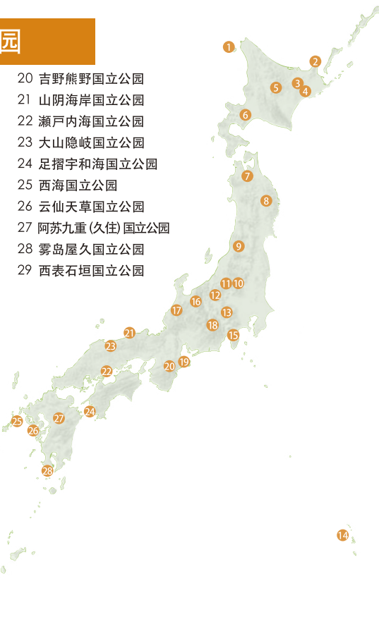
●日本国立公园的土地所有类型