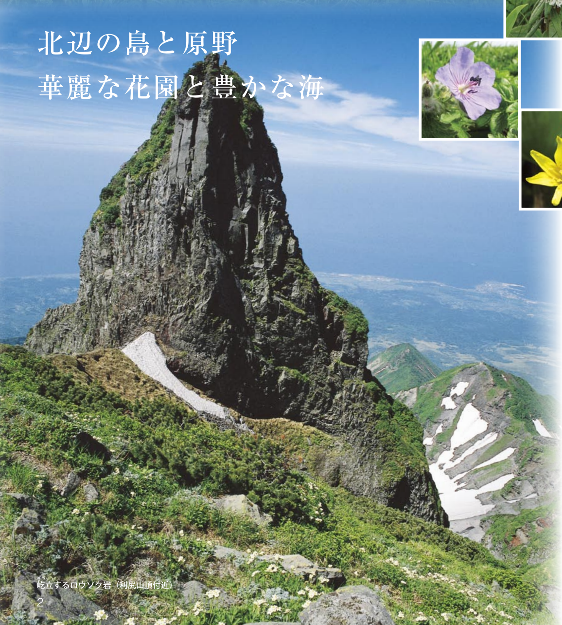
屹立するロウソク岩（利尻山頂付近）